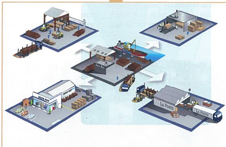
Schéma des fonctionnalités prises en charge par le logiciel ▼