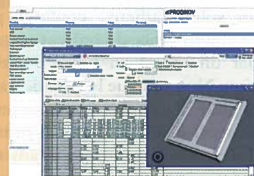
▲ Ecran de saisie des paramètres

On pourrait croire qu'un tel système, qui peut suivre tous types de stocks de bois, de produits finis ou semi-finis, tout au long de leur transformation, est réservé à des grandes structures. Il n'en est rien. La solution de Proginov s'adapte, quelle que soit la taille de l'entreprise. Elle fonctionne aussi bien sur quelques postes qu'en multi-sociétés, multi-sites ou multi-filiales. Peu importe que l'on soit informatisé ou pas avant la mise en place. L'application comme les données peuvent être accessibles à distance. Proginov dispose de ses propres serveurs, sur lesquels votre version du programme est hébergée. Plus de maintenance, ni de mise à jour, ni de gestion de matériel - hormis un ordinateur connecté à internet -, vous disposez d'un système de gestion décentralisé. Une solution idéale pour qui veut s'affranchir de contraintes techniques supplémentaires et accéder à ses résultats, depuis son bureau ou à distance.